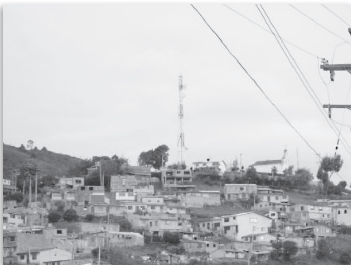
Municipio de Tocancipá.

No obstante, las dificultades en estos años de inicio han sido enormes. El aeropuerto El Dorado, una de las obras más adelantadas, será demolido, cuando ya había sido objeto de remodelación, con los consiguientes costos millonarios de este cambio de decisión. Posteriormente se discutió acerca del diseño de pistas, en equis o en hache, optando por la segunda alternativa que, sin ser la óptima, mejora la disposición de las actuales. Pero quedan por puertas definiciones acerca de las vías de acceso de carga y de pasajeros al terminal y de las autopistas colindantes y, sobre todo, la consideración de los impactos ambientales y en los pobladores vecinos, tanto de Bogotá como de los municipios cerca-