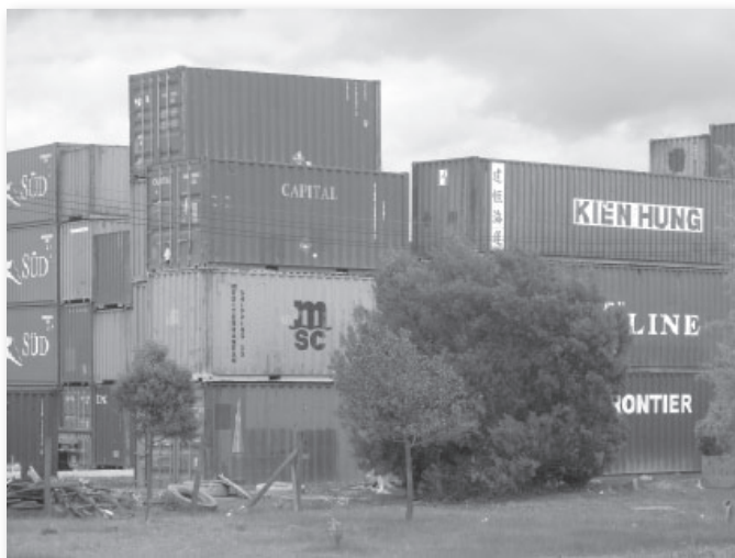
Municipio de Funza.

tra el periodismo crítico y contra la rama judicial; y el programa de Agro Ingreso Seguro, agenciado por el Ministerio de Agricultura, fue develado como el mecanismo central por medio del cual se pretendía reasignar el monopolio de la tierra, incluidas seis millones de hectáreas despojadas a numerosos campesinos en los últimos veinticinco años de guerra, representados estos últimos en algo más de cinco millones de desplazados forzosos.