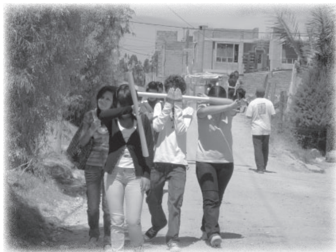
Colectivo de comunicación alternativa. Tocancipá.

2007). Al terminar la primera década del siglo XXI, 2.000.000.000 de personas son pobres urbanos en el planeta. La mitad vive en las barriadas de las ciudades del Tercer Mundo, y la tendencia a un mayor crecimiento de la población urbana en las próximas décadas indica que este se dará en las periferias de las ciudades del sur. En este contexto, de urbanización mundial sin industrialización y sin