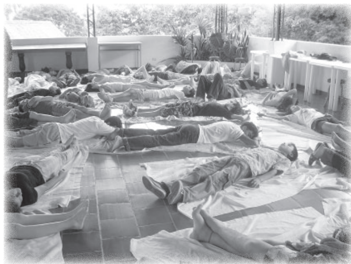
Taller de formación. Sasaima.

El PNCT es el producto de un largo esfuerzo institucional. Su desarrollo ha permitido llegar al consenso interinstitucional de que la acción de la Fuerza Pública, más allá de garantizar los derechos básicos a la vida y la integridad personal,