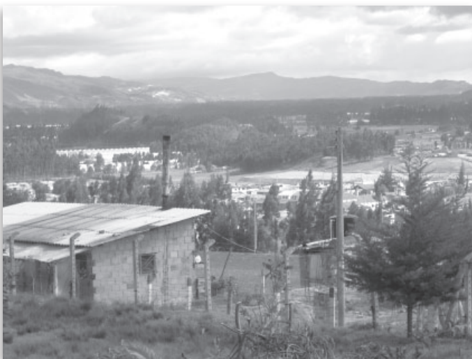
Municipio de Suesca.

conflicto (por lo cual se podría negociar dentro de los márgenes de la norma y se haría innecesario realizar dicha negociación por otras vías) y para ello se recurre a la estrategia de la unidad nacional , o el acuerdo entre partidos 3 , especialmente con sus cabezas, lo que hace más expedita la gestión –formal– en el Congreso. Este último aspecto denota la voluntad de no hacer pactos ilegales ni de conspirar, pero sí la de concentrar el centro de decisiones en un círculo estrecho de contertulios fieles a la ley.