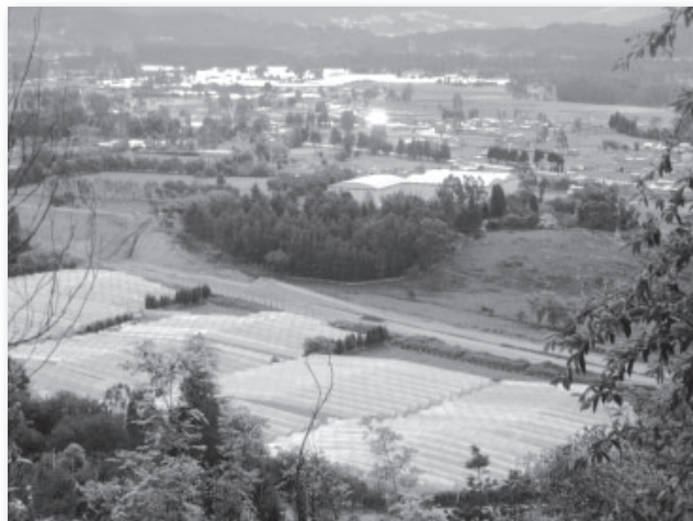
Municipio de Tocancipá.