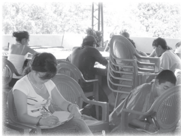
Taller de formación. Sasaima.

das las localidades de Bogotá y de algunos municipios circunvecinos de la Sabana hacia el norte, occidente y sur, surge un espectro de formas de violaciones a los derechos humanos de las que cada uno de ellos conoce directamente por lo menos un caso. Es decir que las personas que denuncian o testimonian la ocurrencia de estos hechos tienen una