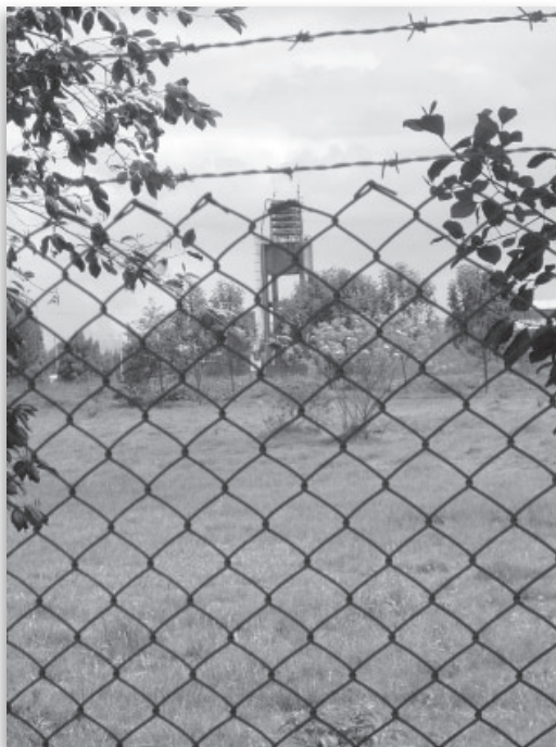
Municipio de Funza.

la columna vertebral la constituyó la Ley 975 de 2005 o Ley de Justicia y Paz y la reforma constitucional que permitió la reelección presidencial (Acto Legislativo de diciembre de 2004 y Sentencia de la Corte Constitucional de octubre de 2005). Entre los cambios institucionales se destacan las fusiones de los Ministerios del Interior y de Justicia, por un lado, y de Salud y Trabajo en el de Seguridad Social, por otro. Todas estas innovaciones lograron acentuar el tradicional régimen presidencialista colombiano, permitiendo únicamente la negociación con personas y sectores del legislativo, mediante intercambios fraudulentos de prebendas; adicionalmente, se hizo costumbre la injerencia directa en las regiones y administraciones locales, donde el presidente consolidó sus fortines personales de poder. La región capital, como lo veremos, fue la excepción en tal sentido.