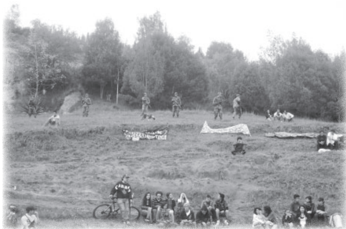
Commemoración 1 de mayo de 2010 en Madrid.

En efecto, las características que toma el posicionamiento del régimen político frente a los jóvenes populares, están contenidas en su política de seguridad ciudadana que se encuentra expresada en el “Capítulo V” del Plan Nacional de Desarrollo: “Consolidación de la paz”. Una presentación elocuente de esos planteamientos se produjo en octubre 4 de 2010, cuando el Gobierno presentó públicamente en Cali (Valle del Cauca) los lineamientos de esa política. El discurso es significativo, no solamente por lo que informa, sino por lo que genera, constituyéndose en la política puesta en acción. Se señalarán y comentarán algunos de sus ejes estructuradores (Presidencia de la República, 2010).