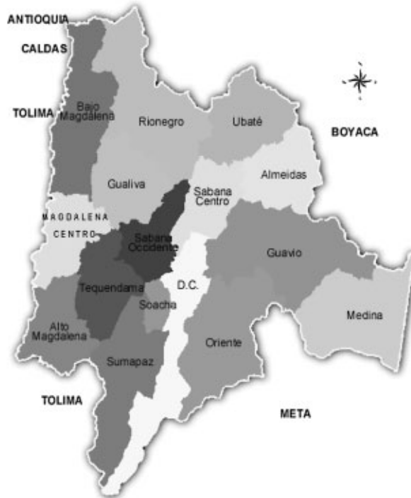
Figura 1. Provincias de Cundinamarca